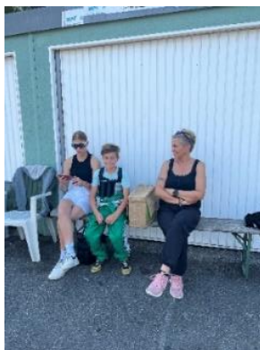
Meine ganze Familie hilft mir bei den Vorbereitungen und steht mir als Fan und Supporter zu Seite.